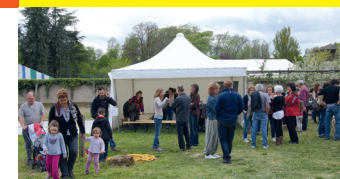
*Les ateliers pratiques sont limités en nombre de personnes. Il est fortement conseillé de réserver vos places.