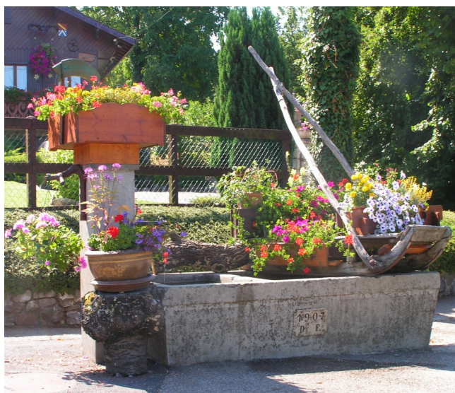
Bassin de Marignan été 2007

Cette année, le thème de décoration est « La rivière »