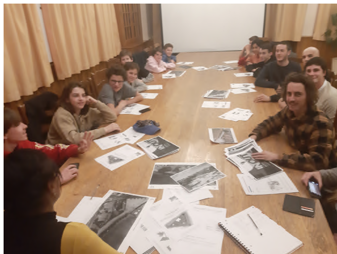
Photo - Skate park : séance de travail à la mairie pour les jeunes

Le Syndicat Intercommunal Sciez, Anthy et Margencel (Sisam) s'est engagé à installer près du site, un "local jeunes" pouvant accueillir une vingtaine de personnes. Les travaux principaux de réhabilitation débuteront en mars pour une ouverture du site au printemps.