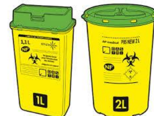
Boîtes à aiguilles

Sur la commune de Sciez, il existe également deux pharmacies en tant que point de collecte (pharmacie de Sciez–route d'Excenevex, et pharmacie de Bonnaitrait).